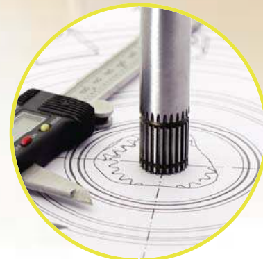
РАЗРАБОТКА НОВЫХ ТЕХНОЛОГИЙ