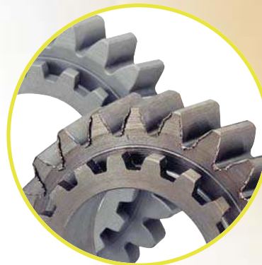
УСЛУГИ ПО ФИНИШНОЙ ОБРАБОТКЕ