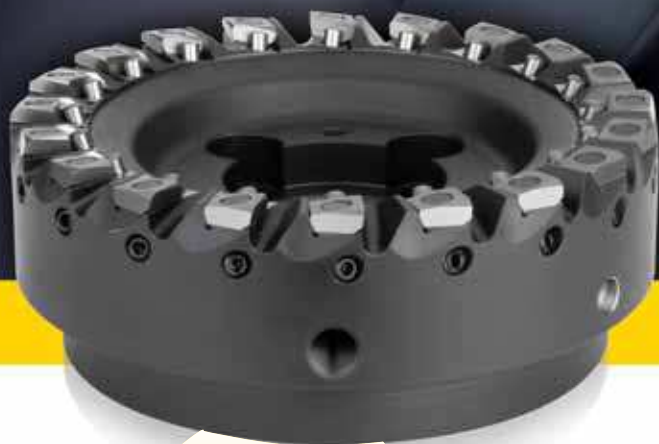
Фреза Fix-Perfect™ для чистовой обработки