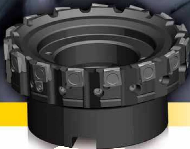
Фрезы Fix-Perfect для обработки чугуна