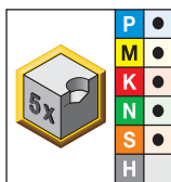
удлинное • KC7325