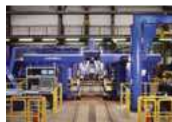
Двухстоечный колесотокарный станок от фирмы Hegenscheidt