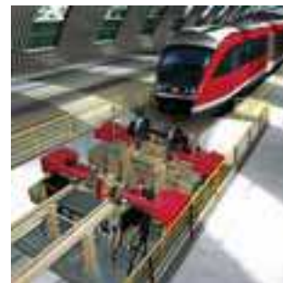
Напольный колесотокарный станок от фирмы Hegenscheidt